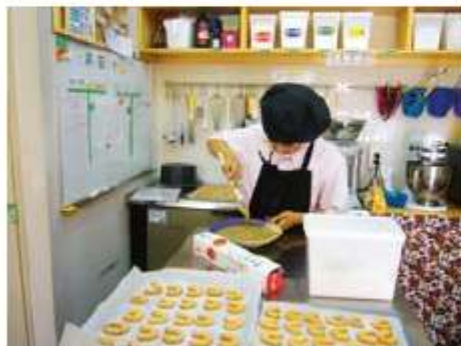
スイーツ工房で人気のクッキーづくり