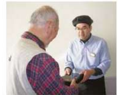
心込めて届けます