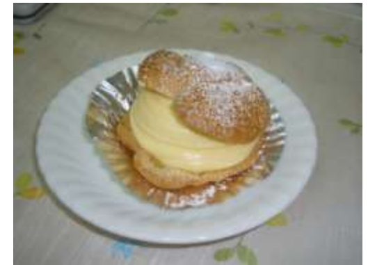
シュークリーム 100円

●週替わりのケーキとして、パウンドケーキ、アーモンドケーキなどがあります。病院のOT祭やバザーなどでシュークリーム、プリン、シフォンケーキなど人気がありました。新メニュー「りんごとさつまいものタルト」は、さつまいもと生クリームを混ぜた生地の上にシロップ煮にしたりんごをのせてあります。(M. O)