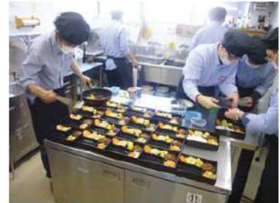
みんなでお弁当を調理します

これらの事業を通じて、障がい者の働く場の確保と、地域の方が安心して暮らせるまちづくりを進めています。